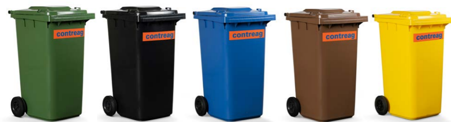
vert anthracite bleu brun jaune