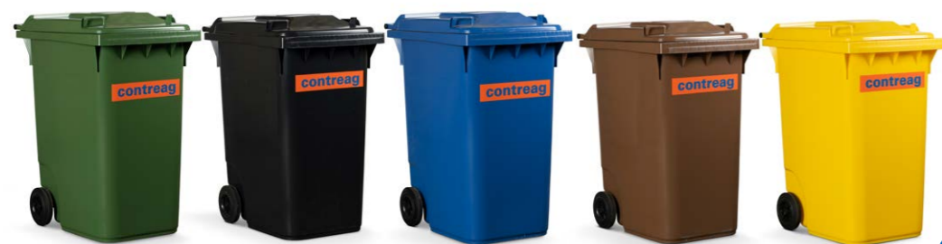
vert anthracite bleu brun jaune