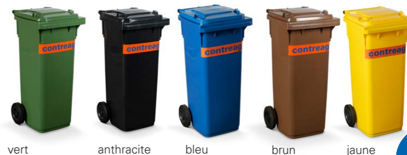
vert anthracite bleu brun jaune

A vendre: qualité – en ligne 24 heures sur 24